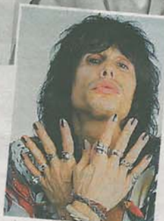
Ché mix! Steven Tyler (Aerosmith), fiero dei suoi anelli e delle sue unghie smaltate di nero

Per il mercato destinato alle under 25 (e dintorni) esiste tutta una gamma di prodot-